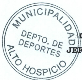
OSVALDO ZENTENO PINTO JEFE DE DEPORTES Y CULTURA